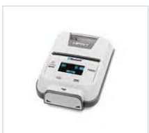
Drukarka HM-E 200