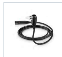
Sonda OAE SnapPROBE™